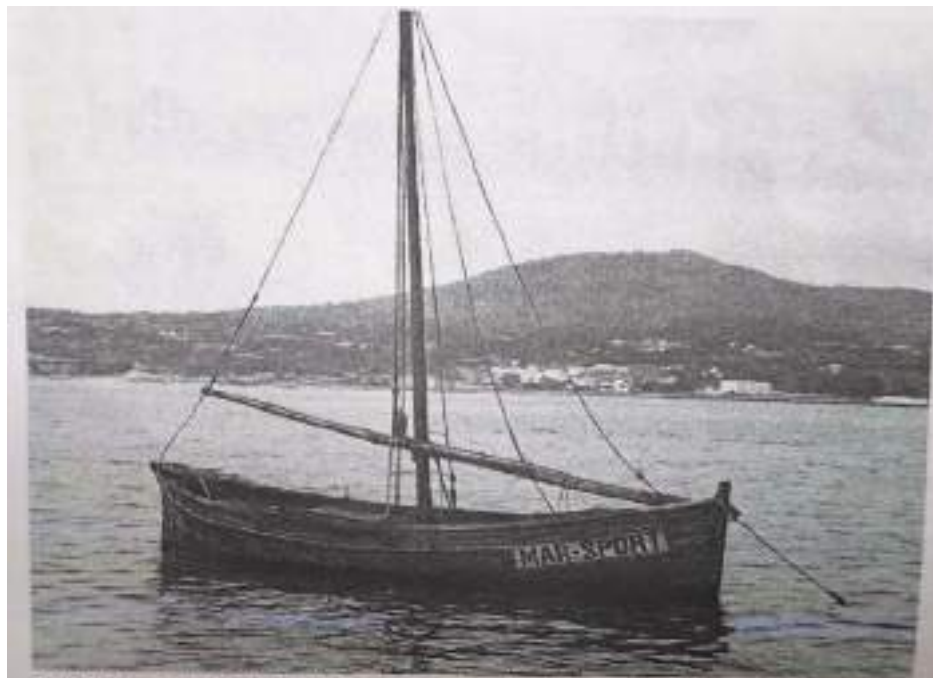
El llaut de Joan Mari 'Mar Sport', construït a Eivissa i amb el qual la família es traslladà a Arenys de Mar.