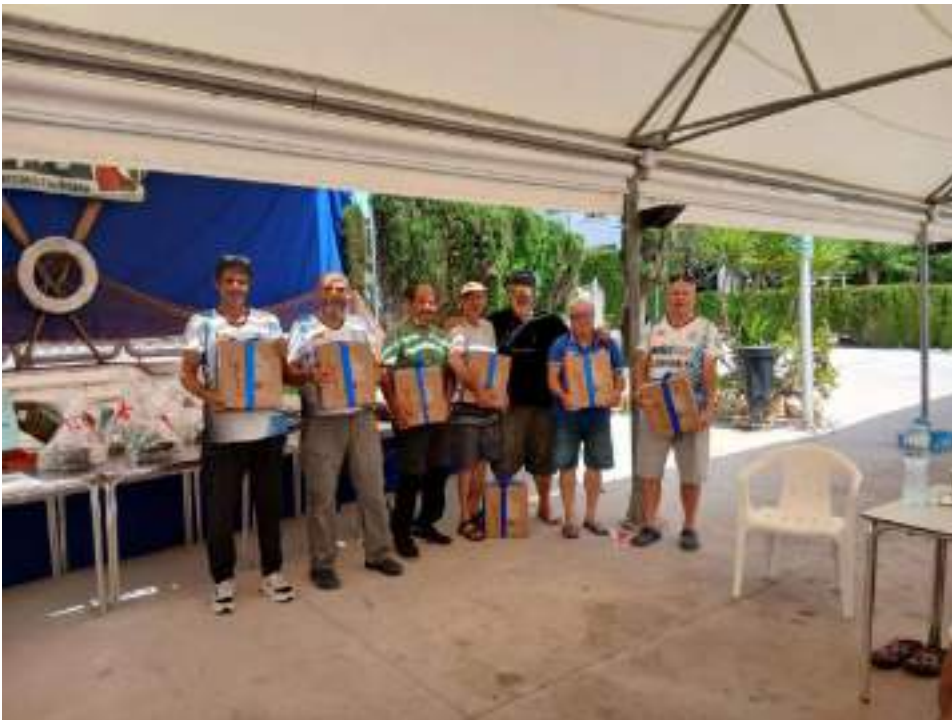
V Open Francesc Estrada